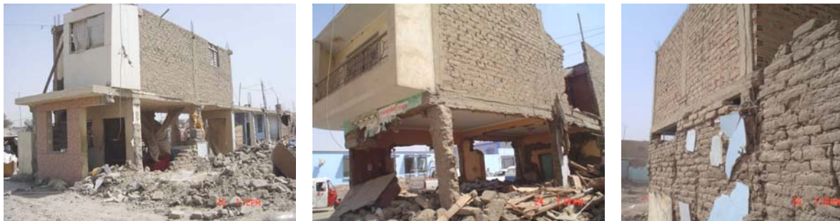
Fig.13. Primer piso de adobe y segundo piso de albañilería. Pisco.

7.4. Ampliaciones. Las ampliaciones de las edificaciones hechas sin ningún criterio técnico, tuvieron muchos problemas en la zona afectada. Por ejemplo, en Pisco se construyeron segundos pisos sobre un primer piso hecho de adobe, empleándose pórticos que incluso estaban fuera del plano de los muros de adobe; el estado en que quedaron estas edificaciones después del sismo aparece en la Fig.13. En las figuras 14 (Pisco) y 15 (Guadalupe), aparecen otras ampliaciones.