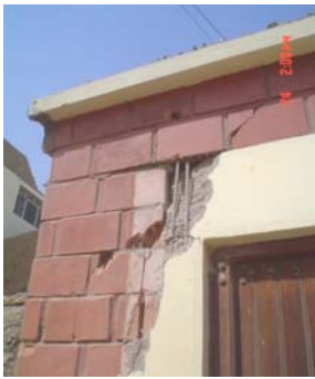
Fig.22 Unión columna-viga, nudo sin estribos. La Norma E.070 obliga a colocar por lo menos 2 estribos.