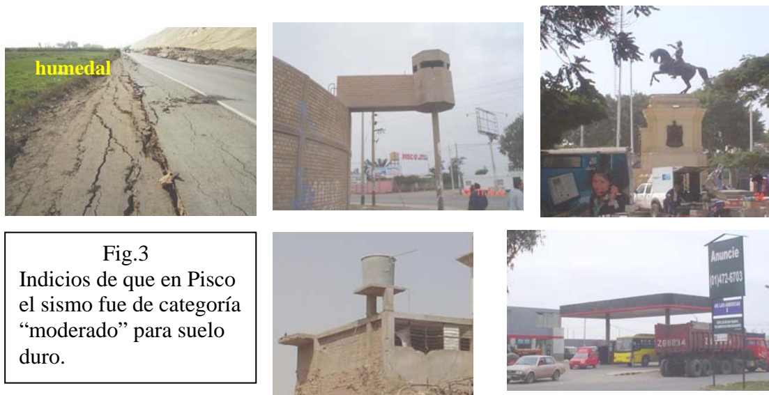
Fig.3 Indicios de que en Pisco el sismo fue de categoría “moderado” para suelo duro.