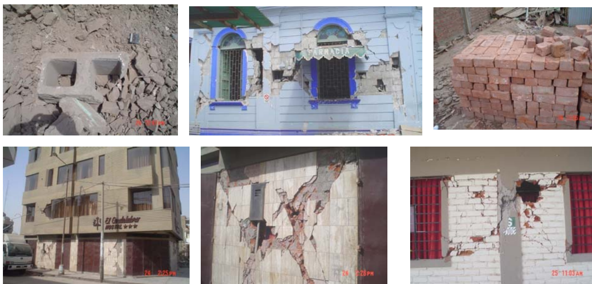
Fig.8A. Uso de unidades inadecuadas en edificios de Pisco e Ica.

De acuerdo a la Ref.5, los ladrillos artesanales de arcilla pueden emplearse para la construcción de viviendas de hasta 2 pisos, y cualquiera de las unidades mencionadas puede ser utilizada para una mayor cantidad de pisos, siempre y cuando el ingeniero estructural demuestre que el comportamiento de todos los muros será elástico (sin ninguna fisura) ante la acción del sismo severo , lo cual podría lograrse mediante la adición de algunos muros de concreto armado.