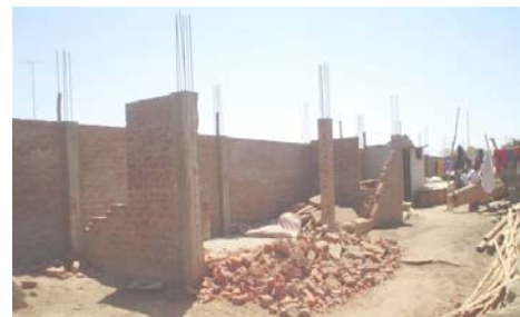
Fig.9. Volcamiento de muros con junta a ras con las columnas. Inadecuadamente las columnas fueron construidas primero y después se levantó la albañilería. Pisco.