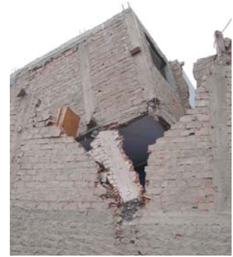
Fig.8B. Ladrillo pandereta en Pisco.