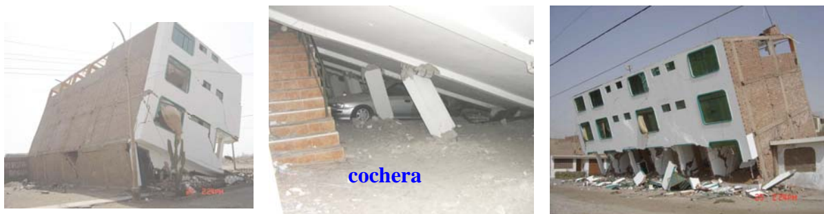
Fig.10. Piso blando y torsión.

7.1. Piso Blando y Torsión. El problema de piso blando se produce cuando hay un cambio muy brusco de rigidez entre los pisos consecutivos. Por ejemplo, en la dirección corta del edificio de la Fig.10, los muros del primer piso fueron discontinuados para transformar el primer piso en cochera, quedando en la dirección corta sólo los muros del perímetro, hechos con ladrillos de baja calidad, y un gran muro longitudinal que no aporta resistencia en la dirección corta, sino más bien genera torsión en planta. Al fallar los muros de la dirección corta, se formó el problema de piso blando, volcándose el edificio.