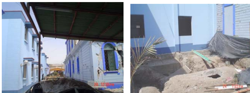
Fig.7 Pabellón nuevo y antiguo del hospital de Pisco.

Las estructuras de albañilería y las compuestas por muros de concreto armado son muy frágiles, basta una distorsión angular de 1/800 como para que se fracturen, por tanto, en suelos de baja calidad como el de la zona central de Pisco (arcilla arenosa con napa freática a 1.5m de profundidad, Ref.4), debió emplearse cimentaciones rígidas de concreto armado. Un caso lo da el comportamiento elástico de un pabellón nuevo del hospital de Pisco (Fig.7), donde se observó vigas de cimentación, mientras que los pabellones antiguos quedaron inutilizados.