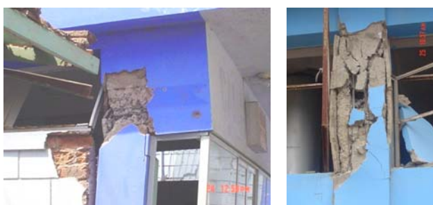
Fig.16 Hospital de Ica.

7.5. Columnas Cortas. La arquitectura clásica que se utiliza en los colegios, universidades y hospitales, continuó generando el problema de columnas cortas en la zona afectada (Fig.16). En ciertos casos, fue el alféizar de albañilería el que falló debido a la baja calidad de los ladrillos y a la robustez de la columna, evitando la formación de la columna corta (Fig.17).