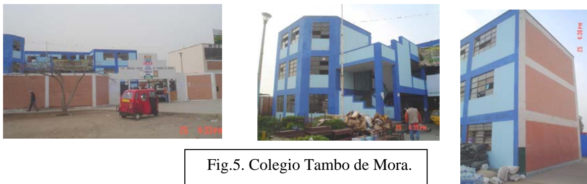
Fig.5. Colegio Tambo de Mora.

Problemas de licuación del suelo arenoso también se presentaron en zonas cercanas a Lima, donde la aceleración máxima en suelo duro fue 0.07g (estación PUCP), como en Puerto Viejo (Fig.6). De esta manera, al esperarse sismos con aceleraciones 6 veces mayores (0.4g, Ref.3), es urgente revisar la posibilidad de reubicar a las edificaciones existentes en los pantanos de Villa, donde también hubo indicios de licuación.