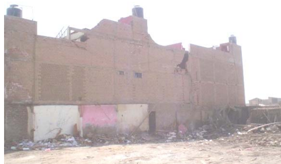
Fig.21. Muros sin solera y con columna discontinua (izquierda), y espaciamiento entre arriostres verticales muy grande (derecha).