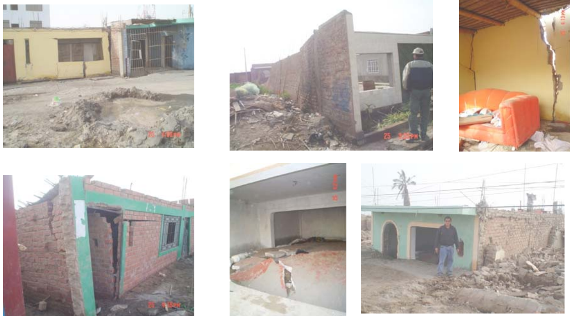
Fig.4. Licuación en el humedal de Tambo de Mora.

Cabe indicar que el colegio Tambo de Mora (Fig.5) queda en un lugar muy cercano a la zona licuada, pero sobre un suelo estable. Este colegio presentó algunas fisuras finas en sus muros de albañilería. La arquitectura de este colegio de tres pisos data de la década de los 90 y es muy similar a la de otros colegios que sufrieron fuertes daños ante los terremotos de Nazca-1996 y Arequipa-2001, por lo que se desprende que las aceleraciones en la zona de suelo estable, deben haber sido las correspondientes a un sismo moderado.