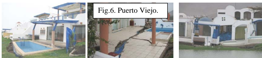
Fig.6. Puerto Viejo.

Problemas de licuación del suelo arenoso también se presentaron en zonas cercanas a Lima, donde la aceleración máxima en suelo duro fue 0.07g (estación PUCP), como en Puerto Viejo (Fig.6). De esta manera, al esperarse sismos con aceleraciones 6 veces mayores (0.4g, Ref.3), es urgente revisar la posibilidad de reubicar a las edificaciones existentes en los pantanos de Villa, donde también hubo indicios de licuación.