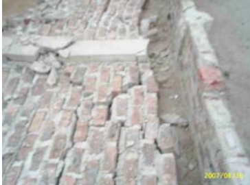
Fig.22 Chilca, columna sin refuerzo (izq.) y con mochetas (der.)

Estos elementos trabajan a carga sísmica perpendicular a su plano y necesitan arriostres que eviten su volcamiento (Ref.5). Desde Lima hasta Ica, pudo observarse que aquellos cercos y parapetos carentes de arriostres terminaron volcándose, incluyendo aquellos donde se utilizaron mochetas de albañilería como arriostre. Un caso curioso ocurrió con un cerco no arriostrado de tapial en el trayecto entre Chíncha Baja y Tambo de Mora (Fig.24), donde en la dirección perpendicular al mar el cerco se mantuvo estable, pero colapsó en la dirección transversal.