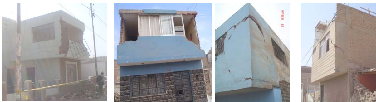
Fig.12. Tabiques sobre voladizos en Pisco y Chincha.

7.3. Tabiques en Voladizos de Fachadas. Para ganar espacio en los pisos superiores, se recurre a voladizos en las fachadas de los edificios, cerrando el ambiente con tabiques de ladrillo pandereta. La conexión dentada entre los tabiques transversales es insuficiente como para soportar las acciones sísmicas perpendiculares al plano y terminan volcándose (Fig.12), pudiendo aniquilar a las personas que escapan por el primer piso. Estos tabiques deben arriostrarse, por ejemplo, usando mallas electrosoldadas (Ref.6).