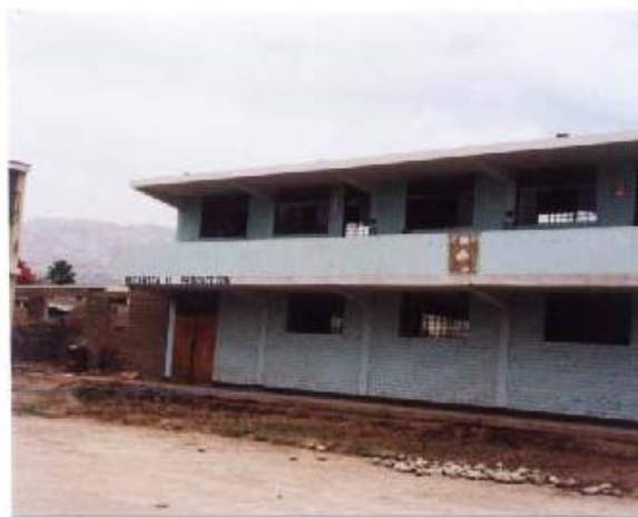
Fig.5. Colegio Fermín Tangüis, Palpa. Pabellón sin Daños.