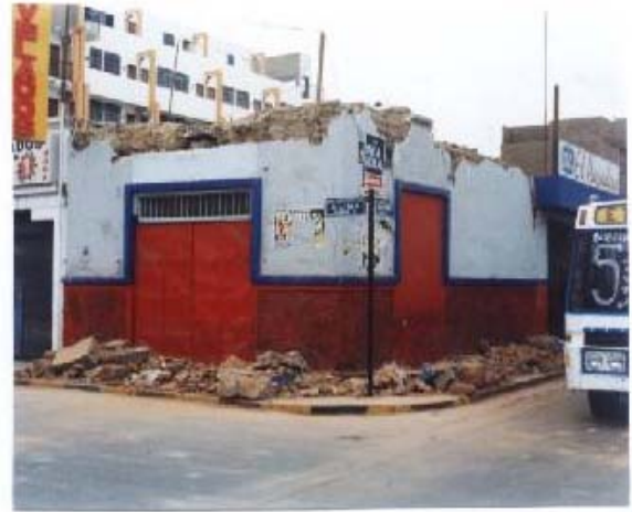
Fig.4. Desplome de Parapeto en Ica.