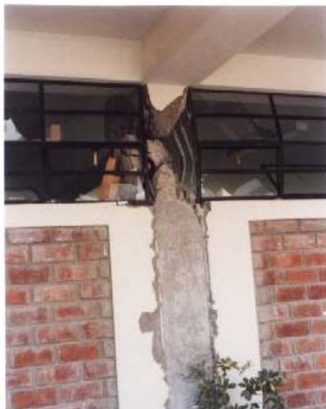
Fig.7. Colegio Fermín del Castillo, Vista Alegre, Nasca. Columna Corta Sin Estribos.