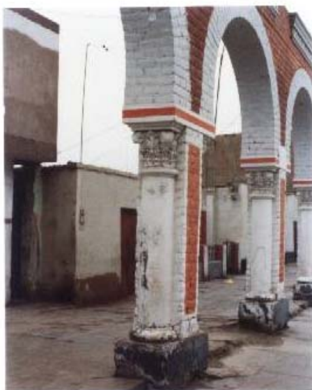
Fig.13 Portales Frente a la Iglesia de Luren, Ica. Falla en la Base, Sistema Inestable.