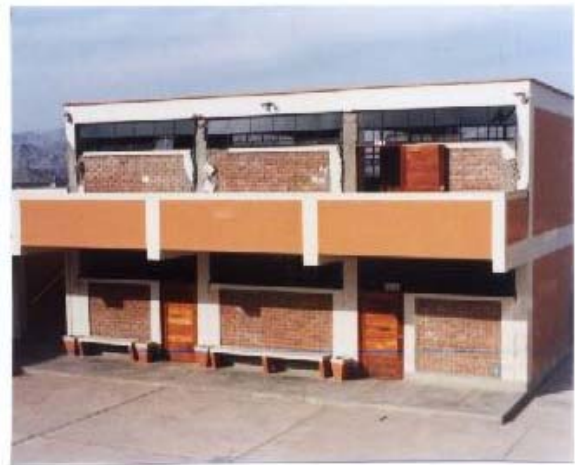
Fig.6. Colegio Fermín del Castillo, Vista Alegre, Nasca. Daños en el Segundo Piso.