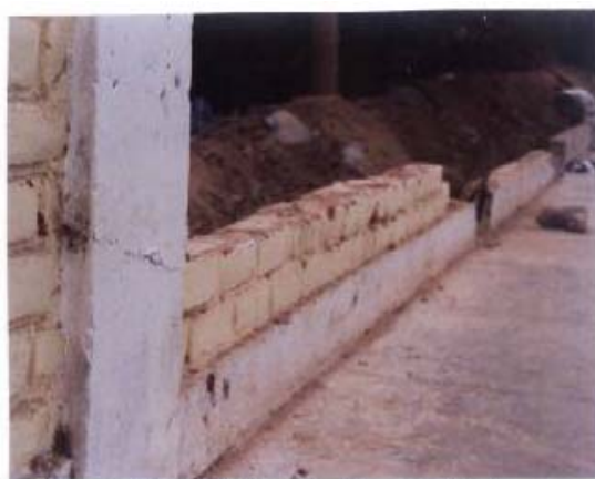
Fig.10. Cerco del Estadio Picasso Perata, Ica. Refuerzo Inadecuado.