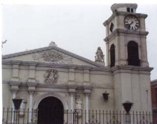
Fig.9. Catedral de Ica. Caída de Estatua y Fisura en la Torre.