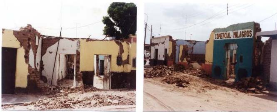
Fig.2. Colapso de Viviendas Antiguas de Adobe Ubicadas en Jr. Lima, Nasca.