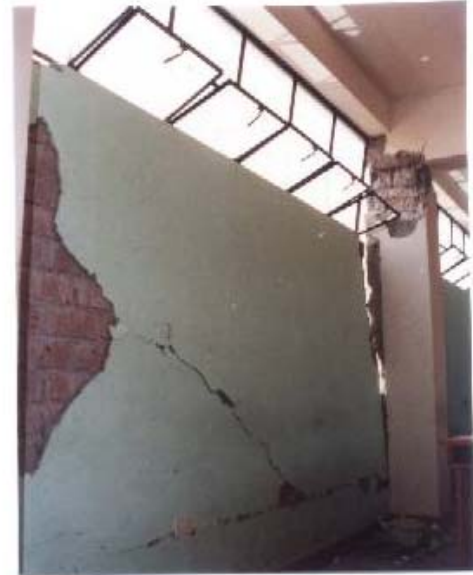
Fig.8. Colegio Fermín del Castillo, Vista Alegre, Nasca. Fallas en Alféizar de Ventana Alta.