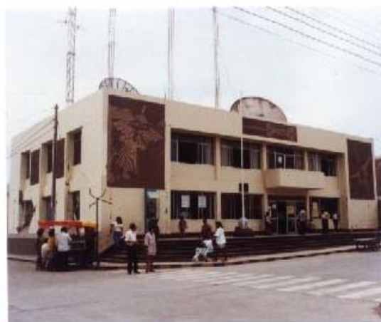
Fig.11. Municipalidad de Nasca. Fallas en la Tabiquería de Albañilería.