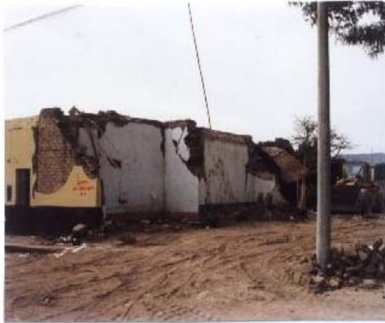
Fig.3. Vivienda de Adobe en Jr. Bolognesi, Nasca.