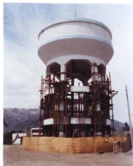
Fig.14. Tanque Elevado en Nasca. Reparación de Nudos Dañados.