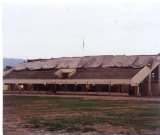
Fig.12. Estadio Municipal de Nasca. Colapso del Techo de la Tribuna.