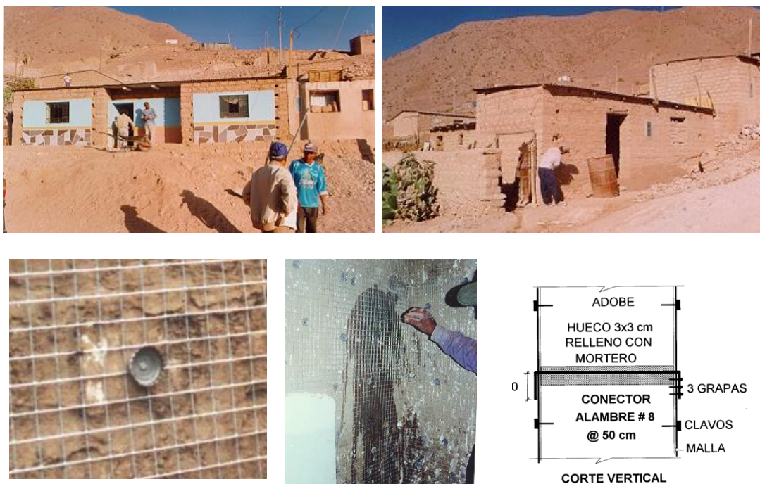
Fig. 1.- Reforzamiento de casas piloto en Yacango, Moquegua, en 1998

manuales y videos a otros países (San Bartolomé, 2007). En Bolivia, Ecuador, Chile y Venezuela se hicieron trabajos similares entre los años 1999 y 2000 (CERESIS, 2000).