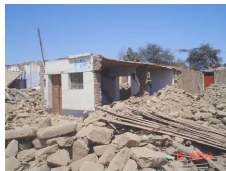
Fig. 5.- Viviendas tradicionales de adobe en Ica, con colapsos por doquier.