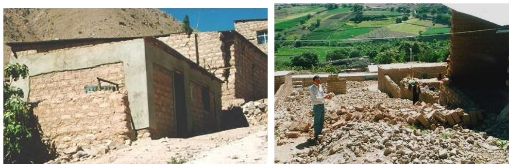
Fig. 2.- Efectos del terremoto del 2001. Casa reforzada en Yacango, Moquegua y casas vecinas dañadas.

El primer comportamiento exitoso de este sistema de reforzamiento se dio en seis viviendas piloto que fueron sometidas al terremoto del 23 de junio del 2001 (M8.4), en el sur del Perú: 3 en Moquegua, 2 en Tacna y una en Arica (norte de Chile). Ninguna de estas casas reforzadas tuvo daño (Zegarra et. al. 2001), en tanto que viviendas vecinas de adobe no reforzado tuvieron fuertes daños o colapsaron (Fig.2).