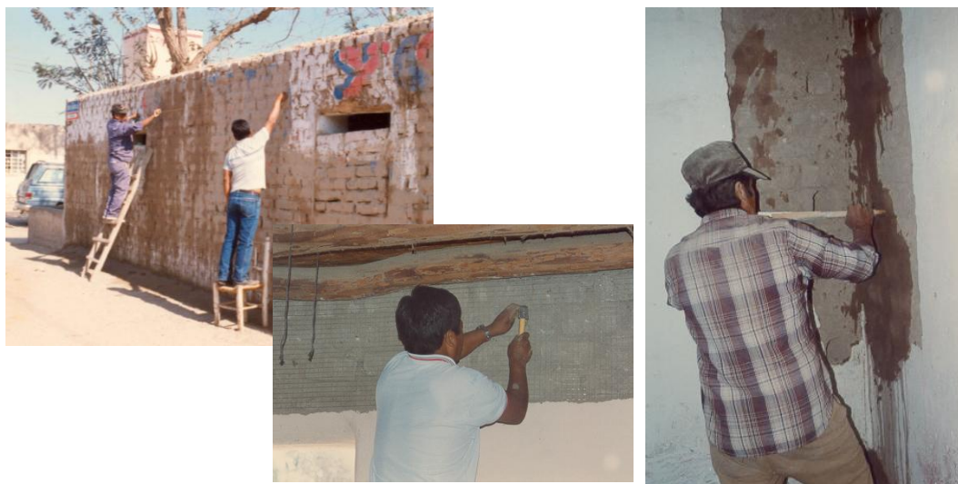
Fig. 3.- Refuerzo en proyecto piloto de Guadalupe, Ica

En la provincia de Ica al sur de Lima, en 1998 se reforzaron dos casas: una en el poblado de Guadalupe, km 293 de la carretera Panamericana Sur (Fig.3), y otra en el poblado de Pachacútec, km 314 de la carretera Panamericana Sur. En general, los muros fueron reforzados en ambas caras, pero en la colindancia con las propiedades vecinas, sólo se reforzó el lado disponible. Los obreros que se capacitaron en estas dos casas de Ica, luego procedieron a aplicar el refuerzo en forma parcial en tres casas más a manera de proyecto demostrativo, sin la asesoría del personal PUCP, una de estas casas correspondió a la estación sísmica de Parcona.