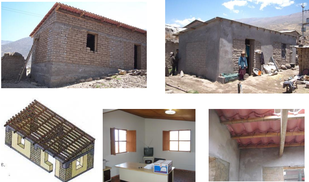
Fig. 6.- Casas nuevas de adobe en Arequipa, proyecto COPASA-GTZ.

El costo promedio fue de US$ 1714 (US$ 47.6/m 2 ), un 37% más que una vivienda tradicional no reforzada. Del costo total, la familia beneficiada aportó 33% en mano de obra no calificada y materiales locales, mientras que el proyecto puso el 67% restante en materiales de construcción, mano de obra calificada y dirección técnica (GTZ, 2003, p.12). Luego, este sistema se extendió a otro tipo de edificaciones, como locales comunales y centros de salud, todo lo cual se ha reportado a nivel internacional (San Bartolomé et.al. , 2004 y Quiun et. al. 2005).