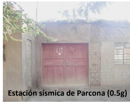
Fig. 4.- Viviendas del proyecto piloto en Ica sin daños tras el terremoto de Ica. (Créditos: Daniel Quiun y Angel San Bartolomé, 2007).