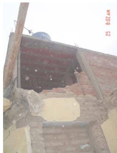
Algunas estructuras de concreto armado y de albañilería, también se vieron afectadas