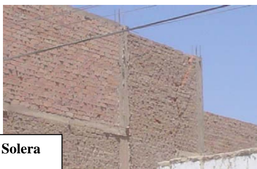
Albañilería sin Solera