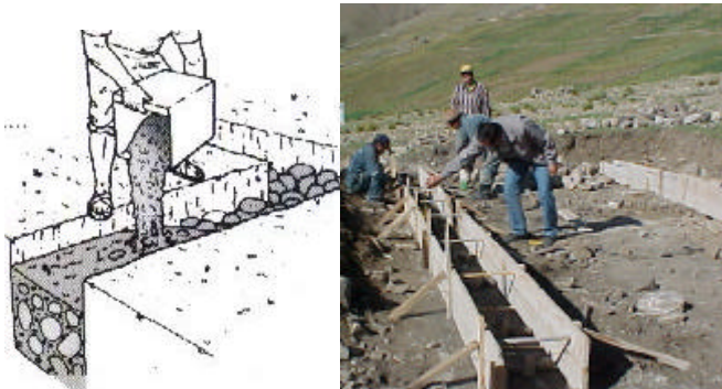
Cimentación y sobrecimiento de concreto ciclópeo