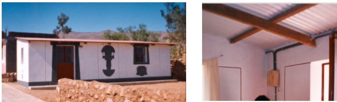
Figura 11. Vivienda construida por el Convenio PNUD-SENCICO.

La fig. 11 muestra vistas de las viviendas construidas por el proyecto SENCICO-PNUD, donde cabe destacar la correcta disposición de las instalaciones eléctricas por el exterior de los muros y techos, a fin de mantener la estructura de los muros intacta.