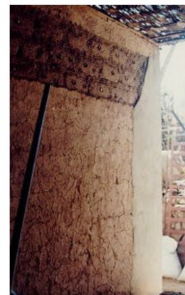
Figura 4. Reforzamiento en viviendas existentes de 2 pisos.