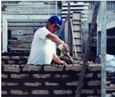
Humedecimiento en el asentado

sísmicos. Esta viga tiene el propósito de conectar los muros, y en caso que en un sismo severo colapsen las zonas del muro sin reforzar, la viga continúe soportando el techo, al apoyarse sobre las esquinas de la casa que están reforzadas con malla electrosoldada.