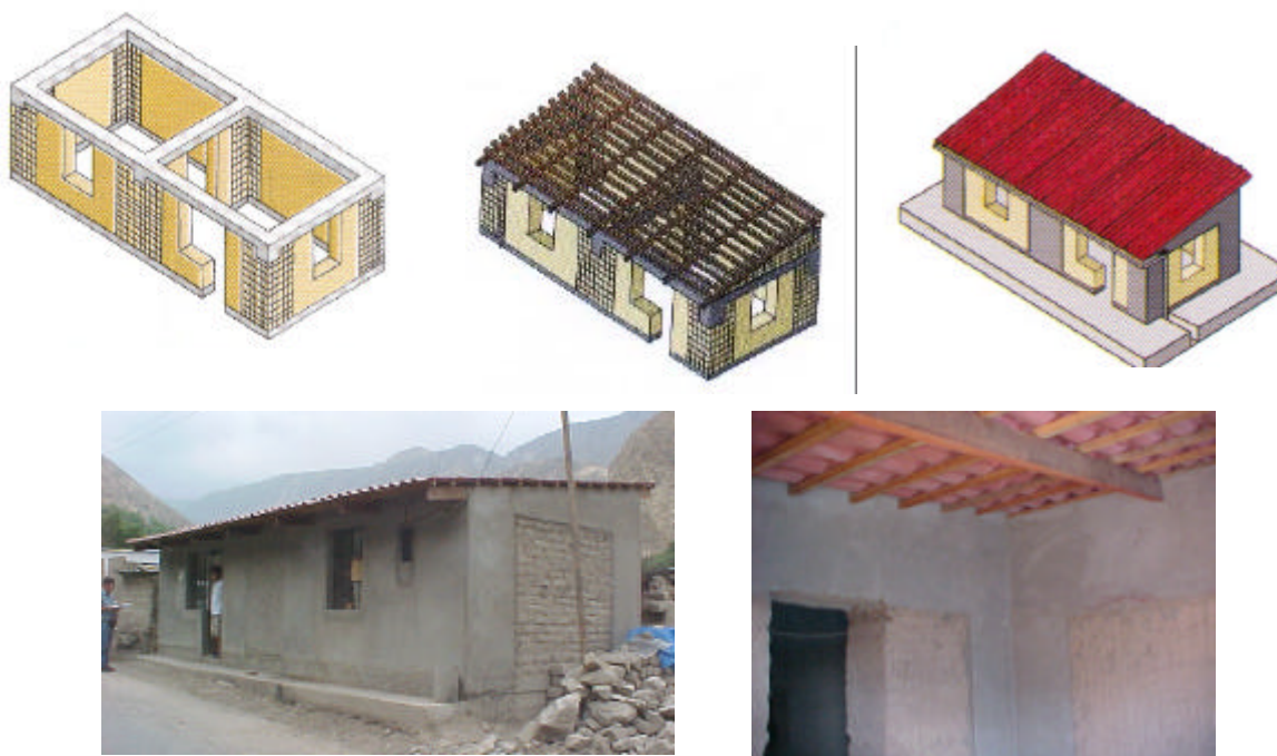
Figura 7. Arquitectura de las viviendas reforzadas construidas por COPASA en Arequipa.

La arquitectura del módulo básico se aprecia en la fig. 7, en la que se nota la ubicación de las franjas verticales de malla electrosoldada cubiertas de mortero de cemento, mientras que la viga solera de concreto pobre ( f'c = 100 \text{ kg/cm}^2 ) hace las veces de dintel en puertas y ventanas. Este módulo se concibió de modo que puede adaptarse a los diferentes terrenos y que en las futuras etapas de ampliación puedan hacerse réplicas de este módulo básico. La ubicación del vano de puerta es intercambiable con un vano de ventana, de acuerdo a las características del terreno donde se ubique el módulo.