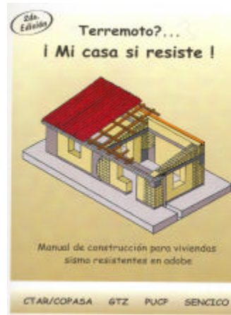
Figura 9. Manual para la construcción de viviendas de adobe reforzado, CTAR/COPASA (2002).

los adobes, la ubicación de los conectores, la preparación y corte de la malla, su colocación, el modo de construir la viga solera, la inclinación y el armado del techo, la cobertura, la colocación de puertas y ventanas, el tarrajeo de la zona con mallas, los pisos, etc.