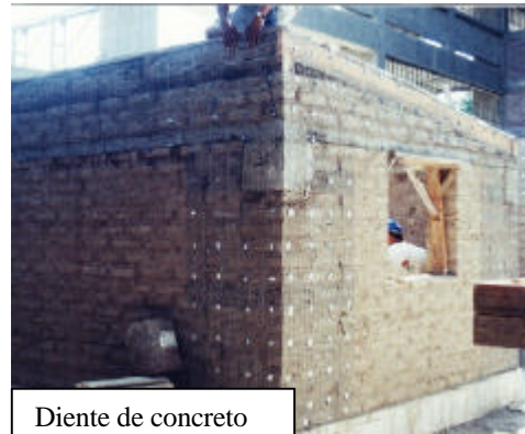
Diente de concreto