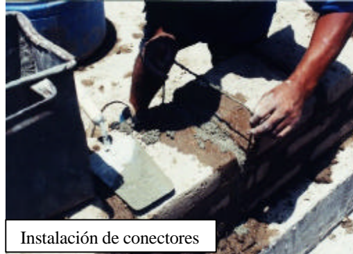
Instalación de conectores