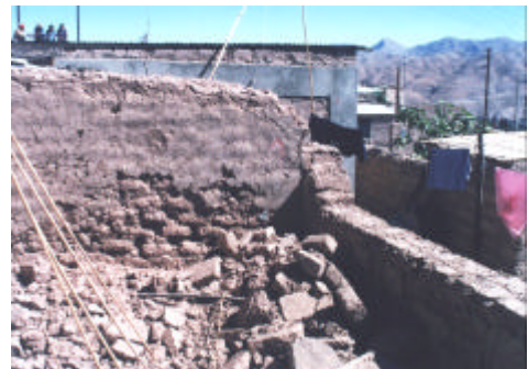
Figura 5. Viviendas reforzadas en 1998 en Moquegua, después del sismo del 2001. Las viviendas vecinas con fuertes daños carecían de refuerzo.