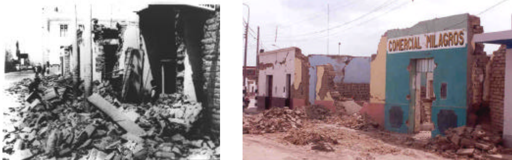
Fig.1. Destrucción de viviendas de adobe no reforzado en el Perú: sismo de 1970 (izquierda) y de 1996 (derecha).

financiamiento de la Cooperación Técnica Alemana (GTZ). En síntesis, se buscaba dar solución práctica al problema del colapso súbito de las construcciones tradicionales de adobe durante los terremotos, que muchas veces ocasionan pérdidas humanas y materiales (fig. 1). El objetivo más importante era dotar a la vivienda de adobe la resistencia sísmica suficiente para que, ante un terremoto, los pobladores pudieran salir de sus casas antes del colapso.