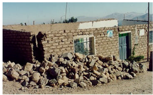
Figura 6. Colapso total y daños severos producidos por el sismo del 2001 en las viviendas de adobe carentes de refuerzo en Moquegua.