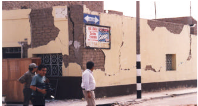
Figura 2. Fallas típicas en viviendas de adobe por acción sísmica perpendicular al plano de los muros: desgarramiento vertical en las esquinas y grieta vertical por flexión en la zona central del muro.