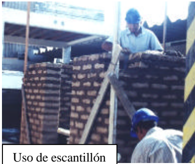
Uso de escantillón