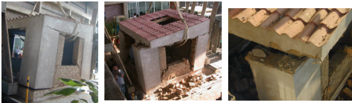
Figura 10. Comportamiento del módulo durante el movimiento sísmico catastrófico (izquierda), después del ensayo (centro) y rotura del diente de concreto (derecha).

El módulo soportó con daños moderados la acción del sismo severo, establecido por la Norma Sismorresistente peruana E-030 (SENCICO, 1997) y quedó al borde del colapso después del sismo catastrófico (fig.10), que generó la rotura por cizalle del diente de concreto ubicado en las esquinas.