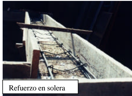
Refuerzo en solera