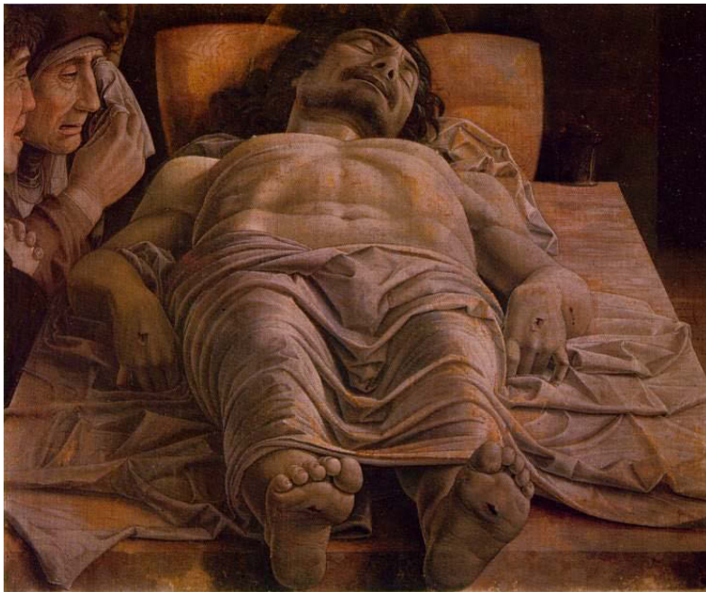
Mantegna, Cristo muerto

La otra gran representación renacentista del Cristo muerto, la de Andrea Mantegna, sitúa al espectador a los pies de la figura yacente. Retratando el cadáver en escorzo muestra de este modo la misma perspectiva que tendríamos de un Cristo ascendiendo a los cielos. La composición vertical de Mantegna señala inequívocamente a la trascendencia. La horizontal de Holbein –una horizontalidad acentuada por las proporciones de la tela, que sugieren las de un nicho– la niega. Los ejes de uno y otro cuadro componen una cruz.