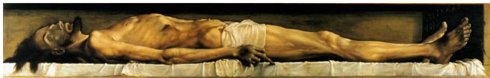
Hans Holbein, Cristo muerto

En su límite, la primera actitud, la que considera al cuerpo una prisión de la que hay que escapar, desemboca en el gnosticismo . El cristo gnóstico es un eón , es decir, una entidad espiritual que se libera definitivamente de su envoltura carnal con la resurrección. 14 La segunda actitud, la que considera la encarnación de Dios como el misterio central del cristianismo, desemboca en el ateísmo . En efecto, el Cristo muerto es el mayor argumento contra la existencia de Dios. Cuando el príncipe Mishkin –el idiota – contempla una copia del Cristo muerto de Hans Holbein en casa de Rogochin, exclama: «¡Este cuadro!... ¡Este cuadro! ¡Ese cuadro puede hacerle perder la fe a más de una persona!». 15