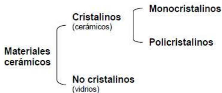
Figura 2. Clasificación de materiales cerámicos

Cerámicos son materiales inorgánicos compuestos por elementos metálicos y no metálicos vinculados químicamente. Pueden ser cristalinos, no cristalinos o una mixtura de ambos. Poseen una alta dureza y resistencia al calentamiento, pero tienden a la fractura frágil. Se caracterizan principalmente por su bajo peso, alta rigidez y baja tenacidad, alta resistencia al calor y al desgaste, poca fricción y buenas propiedades aislantes.