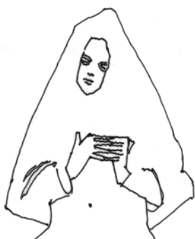
Burbujas en la tina (2000), detalle. Tinta sobre papel: José Edgar Miranda-Ortiz.

Regreso a la relación entre la poesía de César Vallejo y la pintura de Juan Gris para reafirmar la idea ya mencionada: en la obra de ambos artistas lo que importa más es lo que ocultan las obras de arte. Los poemas de Trilce se parecen al cuadro Frutero y periódico 6 de Juan Gris. En este cuadro también podemos identificar los números de la Tetraktys pitagórica en relación con las figuras geométricas. En la pintura pueden distinguirse el punto como número 1, la figura de la botella al centro dividida en dos partes iguales (2), diversos triángulos (3), el cuadrado que enmarca las figuras (4). En este cuadro de Juan Gris pareciera que los elementos del espíritu (colores y figuras geométricas) estuvieran en el momento de parir a los objetos de la realidad (un fragmento de periódico, el detalle de mesa de madera, un frutero). En el caso de Trilce , pareciera que lo más importante no es "lo que dicen los versos", sino lo que está debajo de ellos. De manera análoga, en Trilce pareciera como si los números estuvieran en el momento de parir las palabras y sus posibles significados o niveles de sentido.