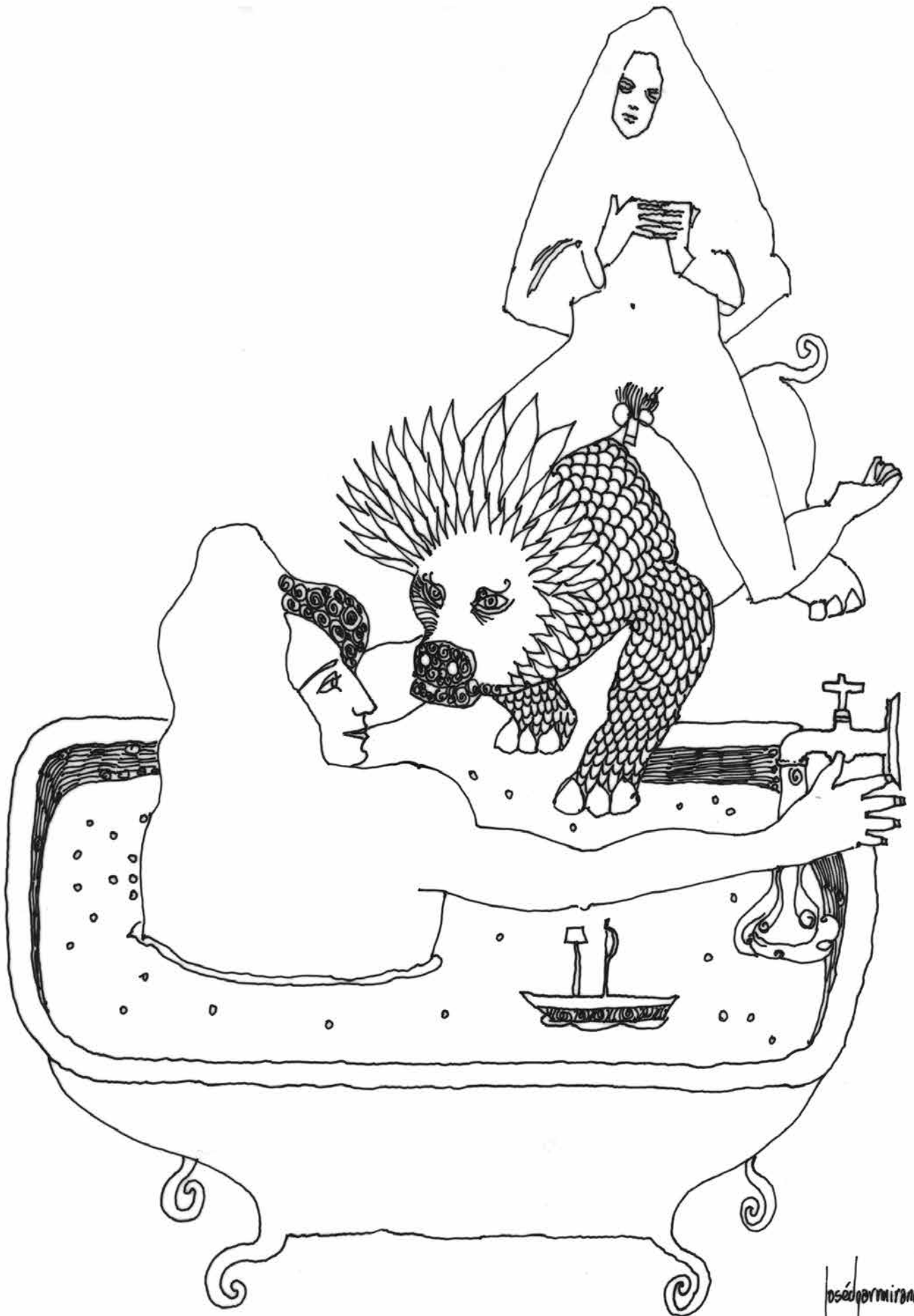
Burbujas en la tina (2000). Tinta sobre papel: José Edgar Miranda-Ortiz.