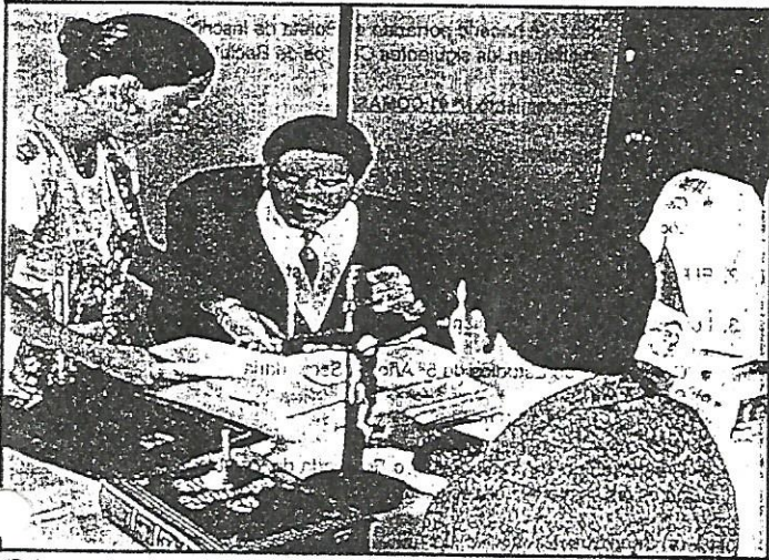
"Debe guardar concordancia la inclusión de nuevas causales de divorcio, como la separación de hecho, frente a lo dispuesto en el artículo 4° de la Constitución."