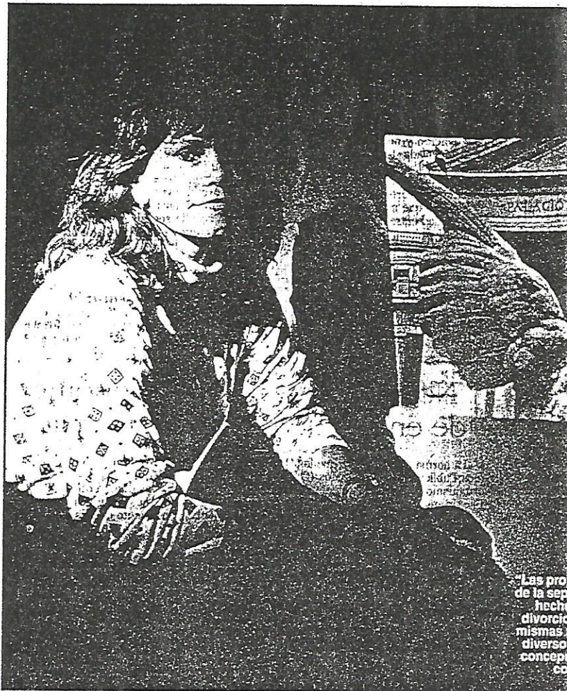
Las pro de la sep hecho divorcio mismas a diverso concept co

Como fundamentos del proyecto se cita, entre otros juristas, al alemán Kahl, quien propone como pauta para apreciar la proce-