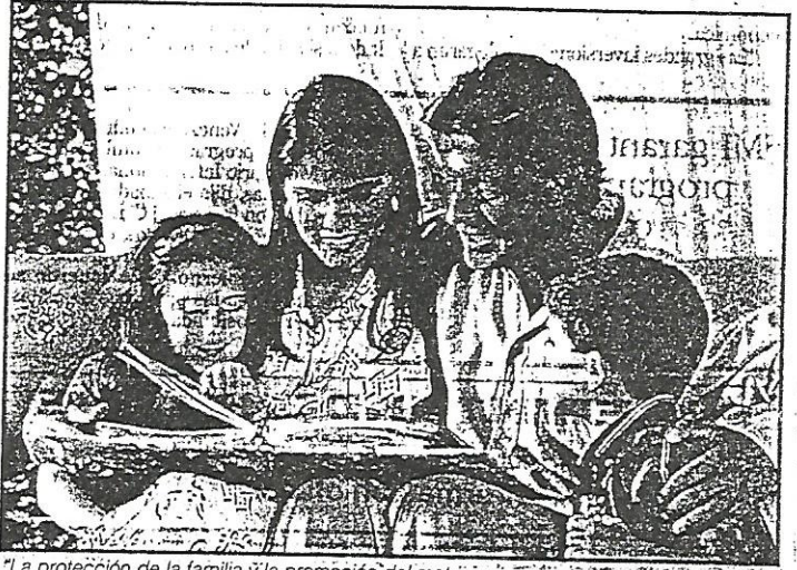
"La protección de la familia y la promoción del matrimonio se encuentran expresamente contempladas en el artículo 4° de la Constitución".

Por ende, antes de propiciar la inclusión de nuevas causales de divorcio, debe realizarse una acción concreta bajo el amparo de la Carta Constitucional con el fin de rescatar los valores familiares y promover efectivamente la institución familiar, dirigida por el Estado, con participación de entidades públicas y privadas.