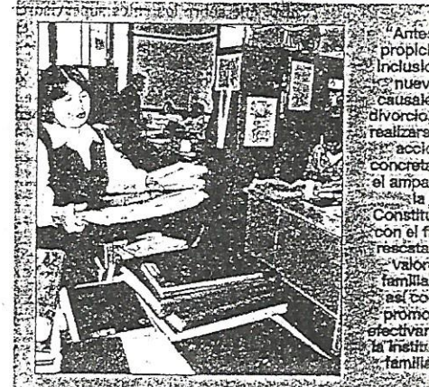
Anter propici Incluído nuev causal divorcio, realizaci acció concret el ampa la Constit con el fi rescata valor familia es co prómo efectiv la instit familia