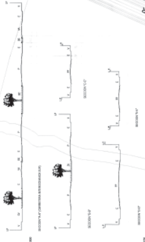
PLANO ZONIFICACION ESC. 10,000